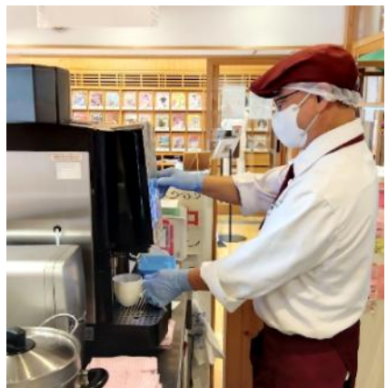
職員 E 図書館内カフェ 接客