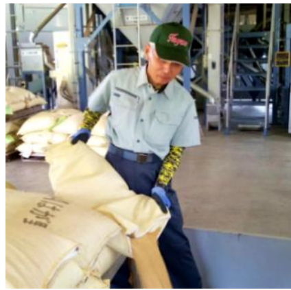
職員 B 農協倉庫 米の集荷補助