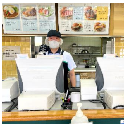
職員 F サーキット内 F F 店 接客