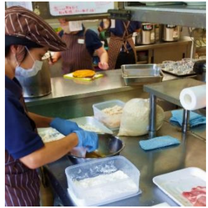
職員 D 蕎麦店 厨房業務