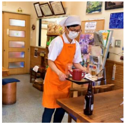
職員 A 蕎麦店 接客