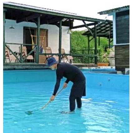
職員 G 宿泊施設 夏のプール営業・管理