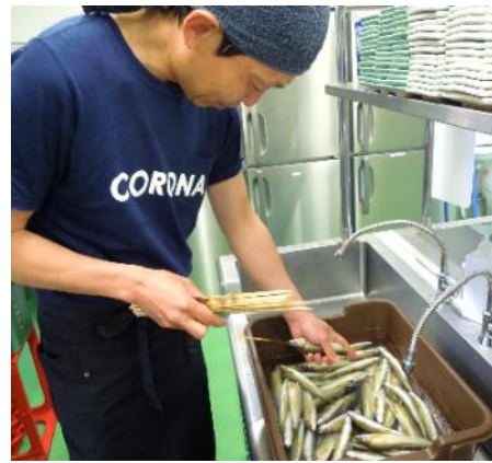
職員 C 観光やな 調理